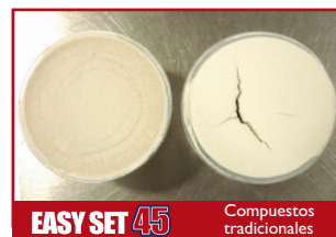
Grado de agrietamiento con espesores altos.